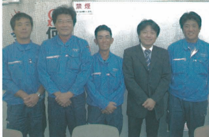
永山社長(右から2番目)と講師陣

受講生の募集期間は25日から11月11日まで、訓練期間は12月1日から23年5月27日まで。訓練場所は、大阪府市平野区瓜破3-3-67。問い合わせは、電話072(650)1011番(担当=大野氏・三好氏)まで。同社のHPは、 http://www.nissho-ngk.com/ (山田克明)